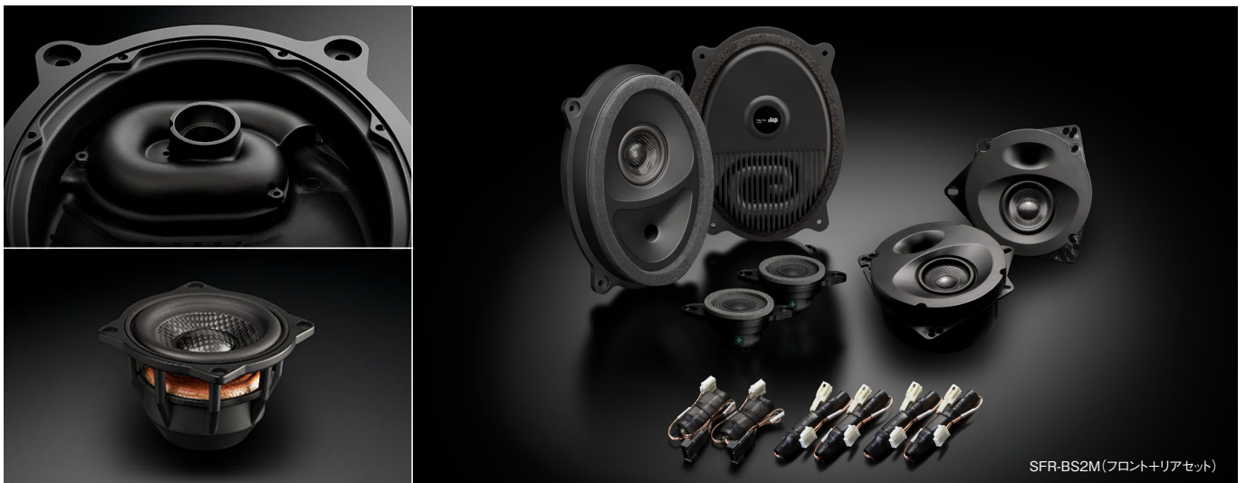
SFR-BS2M(フロント+リアセット)

82,500円(税抜価格75,000円) 取付費別 推奨取付時間:1.0H(リアのみ)