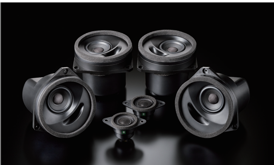
SFR-S01E(フロント+リアセット)