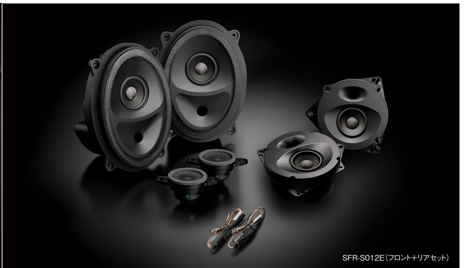
SFR-S012E(フロント+リアセット)