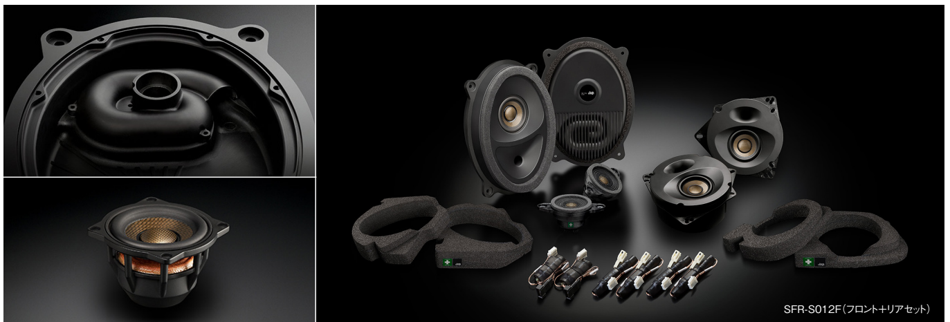
SFR-S012F(フロント+リアセット)

この製品には、ソニックデザイン独自の音響解析・補正ノウハウを結集してオーディオシステムの再生環境を改善するAcoustic Control(アコースティックコントロール)技術を採用しています。