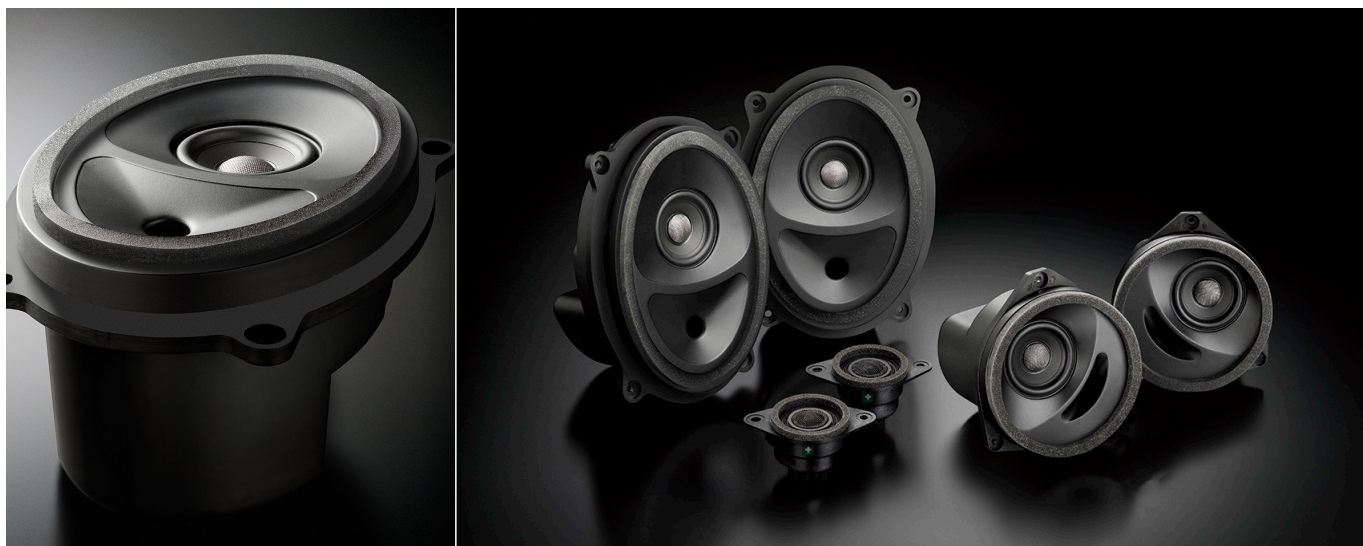
SFR-S03E(フロント+リアセット)

この製品には、ソニックデザイン独自の音響解析・補正ノウハウを結集してオーディオシステムの再生環境を改善するAcoustic Control(アコースティックコントロール)技術を採用*しています。 *トウィーターモジュールハウジングに採用