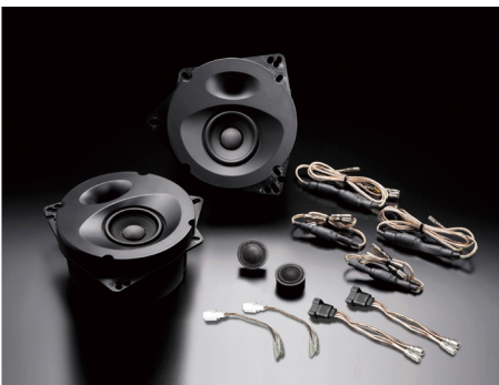
SP-R501E【ディスプレイオーディオ専用】