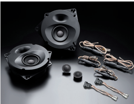
SP-AQUA2 (純正6スピーカー装着車・フロント専用)