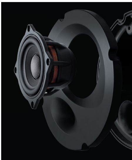
エンクロージャ一体型フルレンジモジュール

SF-AQUA111E スピーカーパッケージ 38,500円(税抜価格35,000円) 取付費別 純正2スピーカー装着車・フロント専用 推奨取付時間:1H