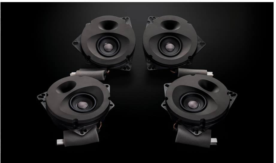
SFR-AQUA111 (純正4スピーカー装着車・フロント+リア用)