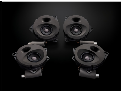
SFR-CX101E (4スピーカー車対応モデル)