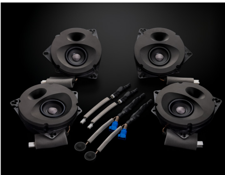
SFR-CX102E (6スピーカー車対応モデル)