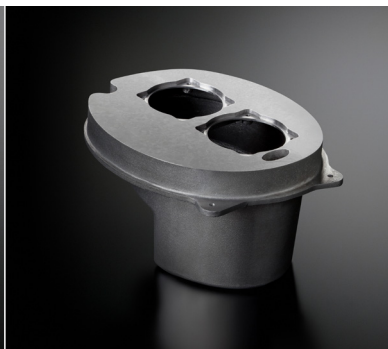
ソノキャスト ARMS エンクロージャ