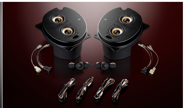
1C-P30 Single Crest (ネットワーク付属)