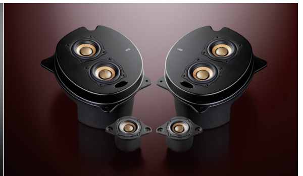
3C-P30L Triple Crest