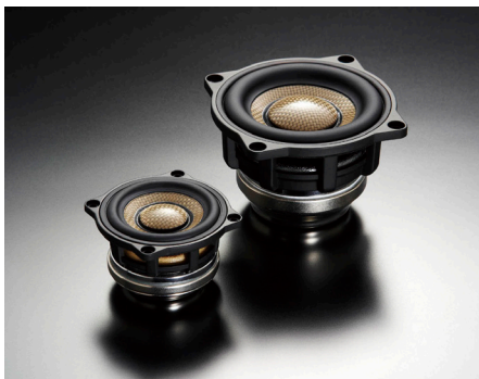
SD-N52N 型(左)とSD-N77N 型(右)

3C-P30L Triple Crest スピーカーパッケージ 1,595,000円(税抜価格1,450,000円) 取付費別 受注生産品 ネットワークレス仕様