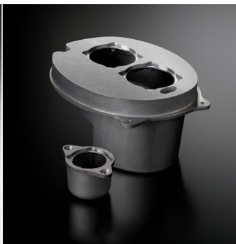
ソノキャスト ARMS エンクロージャ