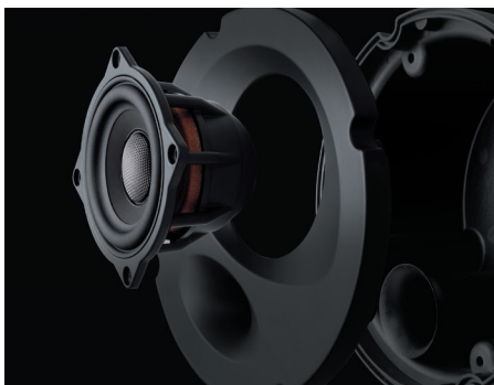
エンクロージャ一体型モジュール

SP-N81E スピーカーパッケージ(フロント/リア両用) 本体価格35,000円(セット)+税 取付費別 純正6/4スピーカー装着車専用 推奨取付時間: フロント1H/リア1.5H