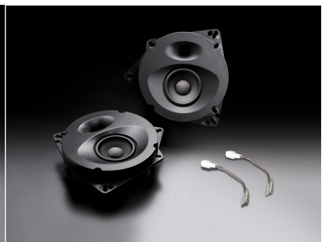
SP-N81E (フロント/リア両用)