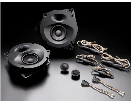
SP-S171E (純正6スピーカー装着車・フロント専用)