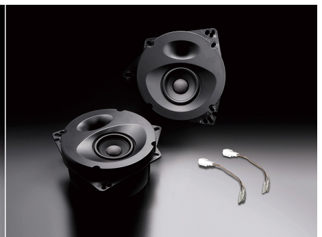
SP-S17E (純正4スピーカー装着車・フロント専用)